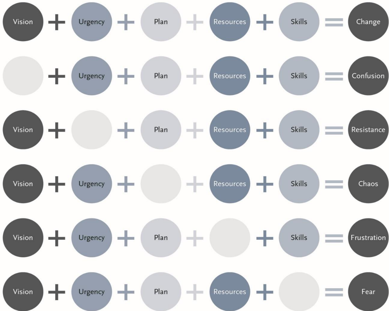
Image 19.4 Results of change management with and without Lippitt's five elements